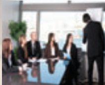
Animation board experts