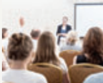
Staff en live®